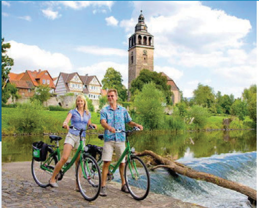
Folgen Sie den malerischen Windungen der Werra

Von den Höhen des Rennsteigs windet sich die Werra, malerisch eingezwängt zwischen Rhön und Thüringer Wald. Auf dem Weg zur Drei-Flüsse-Stadt Hann. Münden, wo sie sich mit der Fulda zur Weser vereinigt, durchqueren Sie pittoreske Fachwerkorte, Kurorte, Residenz- und berühmte Kulturstädte.