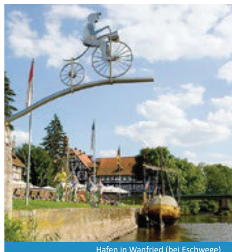
Hafen in Wanfried (bei Eschwege)

Viele Seen und Naturschutzgebiete säumen Ihren Weg entlang der windungsreichen Werra, und schon bald ist Eisenach erreicht. Nehmen Sie sich genügend Zeit für die Besichtigung der Wartburg und besuchen Sie auch die Wirkungsstätten berühmter Söhne der Stadt, zum Beispiel im Bachhaus oder im Lutherhaus.