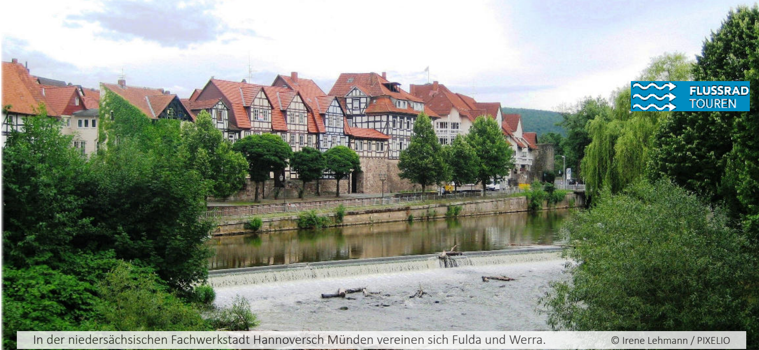
In der niedersächsischen Fachwerkstadt Hannoversch Münden vereinen sich Fulda und Werra.