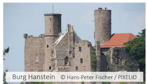
Burg Hanstein