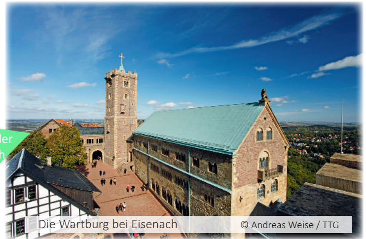
Die Wartburg bei Eisenach