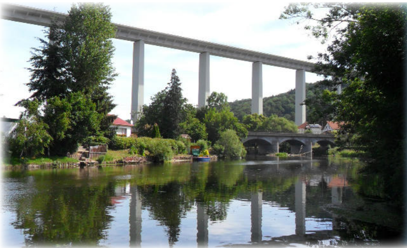
Die Werra in Horschel vor beeindruckender Kulisse

Der Werratal-Radweg ist an Vielfalt kaum zu überbieten: pralle Naturromantik, blumige Auen, stolze Burgen, fachwerkbunte Orte voll freundlicher Menschen, Kultur pur – und das seit 20 Jahren grenzenlos. Der Werraradweg führt durch den Thüringer Wald und am Rennsteig vorbei an vielen Natur- und Kulturdenkmälern.