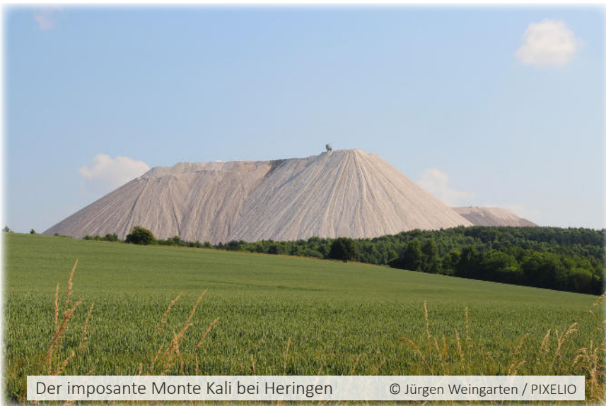
Der imposante Monte Kali bei Heringen