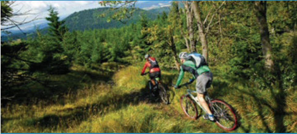
Entdecken Sie den Thüringer Wald ...

Knackige Trails, tiefgrüner Thüringer Wald und traditionsreiche Etappenorte erwarten Sie auf Deutschlands bekanntestem Höhenwanderweg – dem Rennsteig.