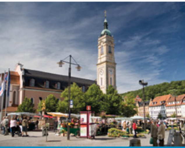
Georgenkirche am Markt

Schwierigkeit: leicht bis mittel, meist asphaltiert, teilweise hügelig