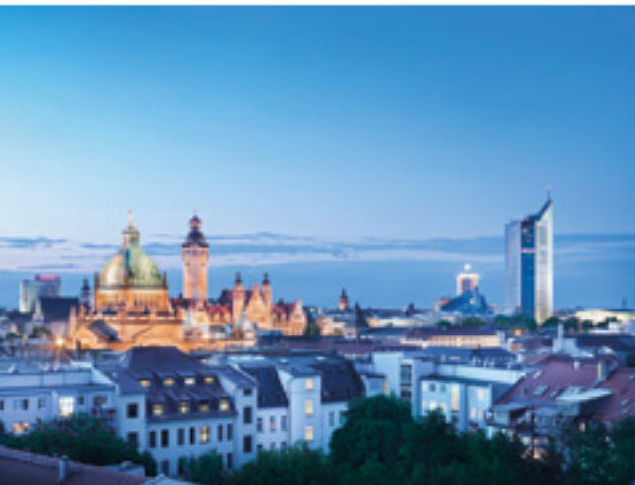
Skyline von Leipzig