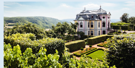
Rokokoschloss mit Barockgarten in Dornburg